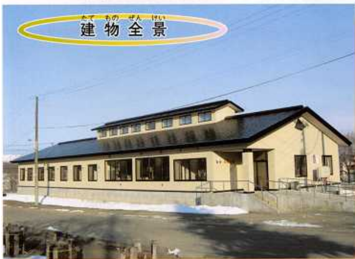
たてものぜんぱい 建物全景

ほんしせつ めいしやう りやうしゃひとり ひかりかがや あす きほう み あさひ いえ しょうがいしゃ しゃ 本施設の名称は、利用者一人ひとりが光輝き明日への希望に満ちた「朝陽の家」としました。障害者の社 かいじりつ そうき じつげん ざいたくしょうがいしゃ じりつしえん か そな しえんしせつ こんご しえん 会自立が早期に実現できるように、また、在宅障害者の自立支援も兼ね備えた支援施設であり、今後の支援 サービスのかくじやう きやうか きたい サービスの拡充と強化に期待されます。