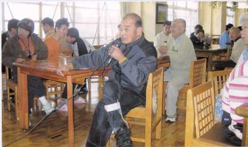
“お正月” しょうがつ カラオケ、おいしい食事 しょくじ 楽しいひとときでした。