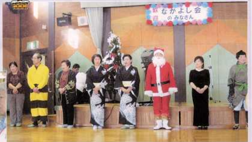
12 / 25 恒例のなかよし会 こうれい の皆さんとクリスマス会 かい