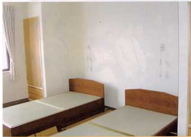
ふたりべや じょう 二人部屋 10帖

ぜんしつ エアコン、床暖房、換気扇、ナース コール、ベット、机等装備で明るく落着 いた室内に仕上がっています。