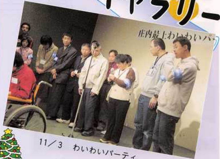
11 / 3 わいわいパーティ