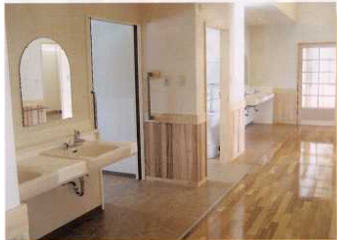
せんめんじょ 洗面所