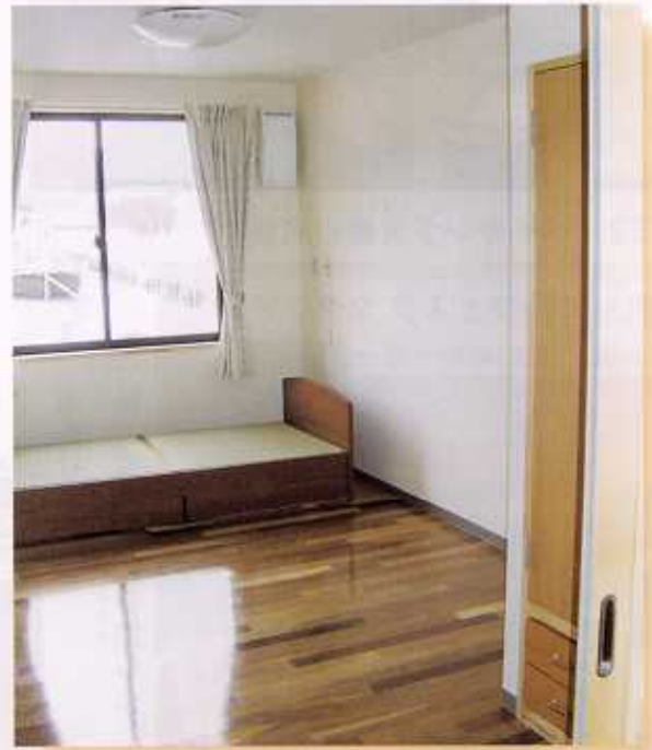
ひとりべや 一人部屋 8帖

ぜんしつ エアコン、床暖房、換気扇、ナース コール、ベット、机等装備で明るく落着 いた室内に仕上がっています。