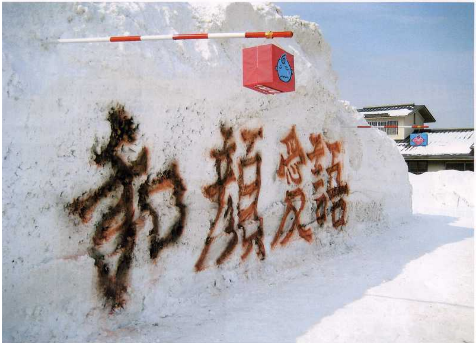
雪まつりのモニュメント

〒999-6105 山形県最上郡最上町大字富沢4467 TEL 0233-45-2236(代)・FAX 0233-45-2011 HPアドレス： http://www.vega.ne.jp/mogamifg/ Eメールアドレス：mogamifg@vega.ne.jp