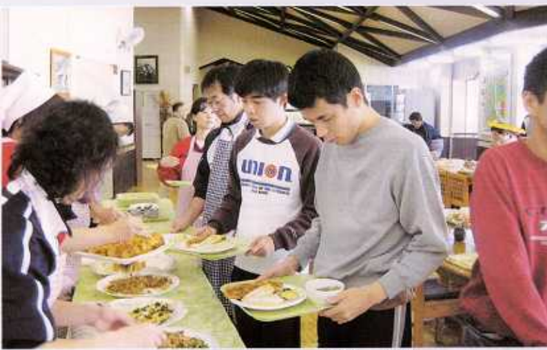
11 / 22 バイキング しょくじ 食事の風景 ふうけい