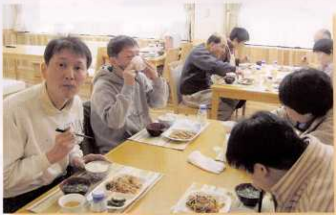
しょくじふうけい 食事風景

しょくじ じかん 食事の時間ですよ～。 がつ よっか しこうてき しょうかいし あさゆう みな 2月4日から試行的に使用開始しました。朝夕に皆で はいぜん みな あとかた なご かていてき ふんいき 配膳、皆で後片づけ。和やかで家庭的な雰囲気です。