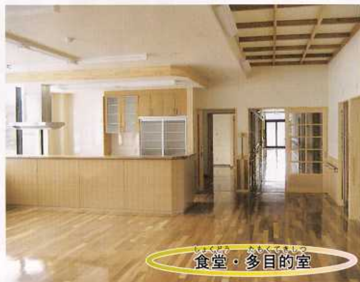
しょくどう たくもくじむしつ 食堂・多目的室