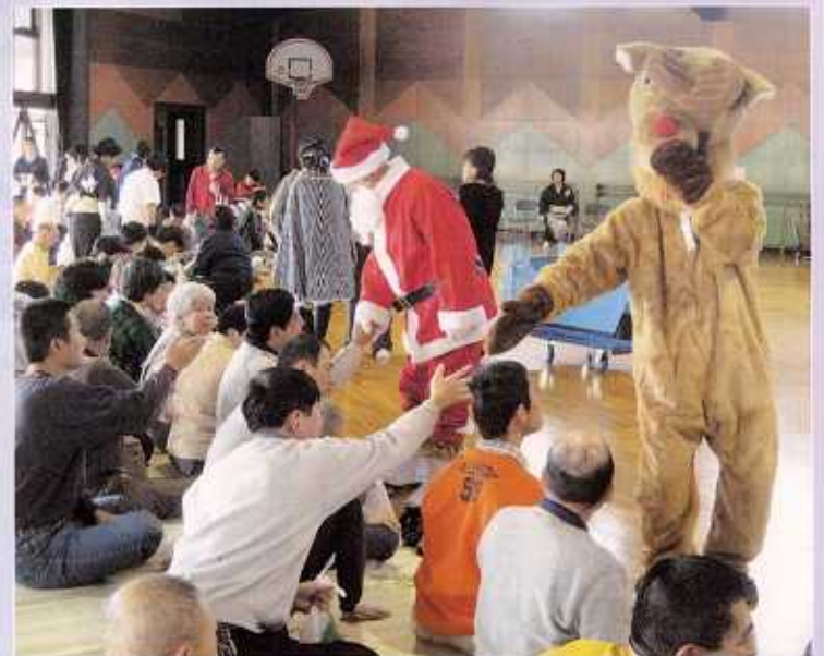
サンタとトナカイ らいえん も来園。 楽しいクリスマス会 かい