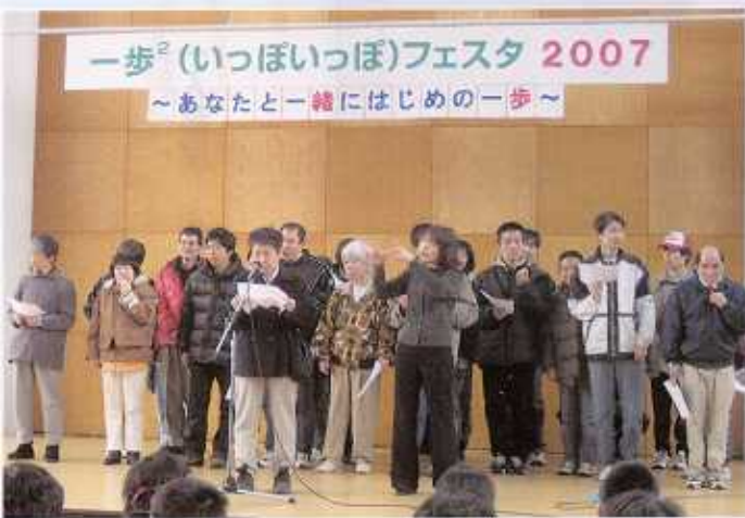
12 / 7 ゆめりあにて 一歩 いっぽ フェスタに参加 さんか しました。