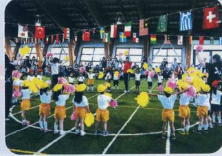
わ 輪になっ ぽど てって踊ろう