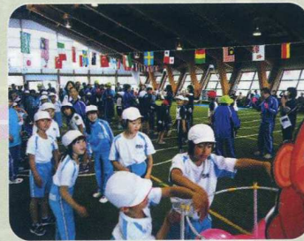
はい 入ったよ 👍