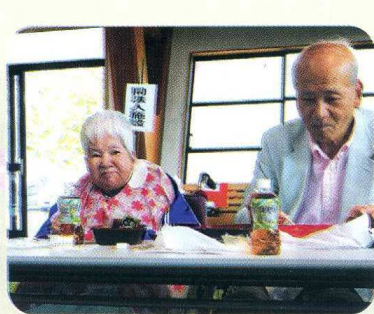
ひる たの お昼は楽しい ♪