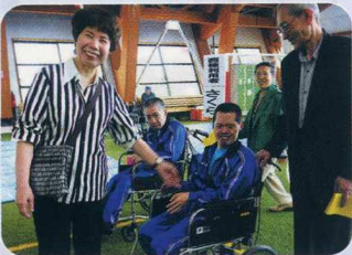
えがお はじける笑顔 😊