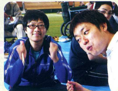
ひる た がんば お昼を食べて頑張るぞ!