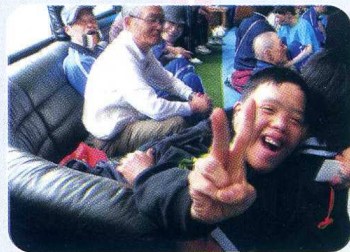
たの 楽しい~ ♪