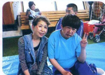
ちよっとはずかしい