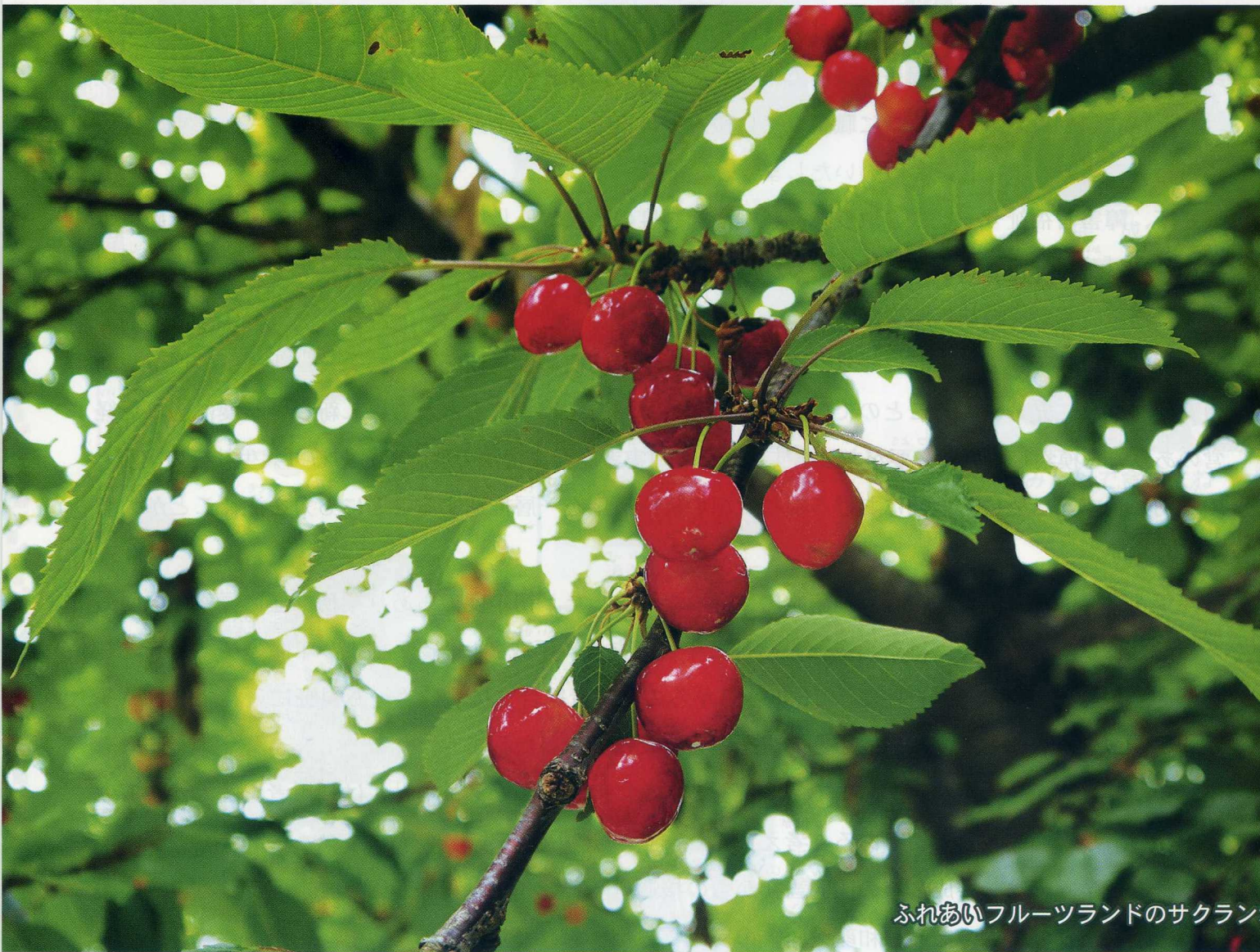
ふれあいフルーツランドのサクラン

やまがたけんもがみぐんもがみまちおおあざとみざわ ☎999-6105 山形県最上郡最上町大字富沢4467 TEL 0233-45-2236(代)・FAX 0233-45-2011 HPアドレス： http://www.vega.ne.jp/mogamifg/ Eメールアドレス： mogamifg@vega.ne.jp