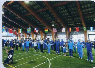
あお さんみやく 青い山脈 !!

スポーツフェスタが、大勢の皆さんを交えて開催する の方々の協力の賜物です。開会式後のセレ スポーツフェスタを盛り上げようと頑張ってくれま のお遊戯は、皆さんの目を和ませてくれました。 々、関連施設の皆さんの弾ける様な笑顔に溢れ き、大変おいしくいただきました。午後の種目 な雰囲気で行進し、閉会式で大団円となりました にしております。