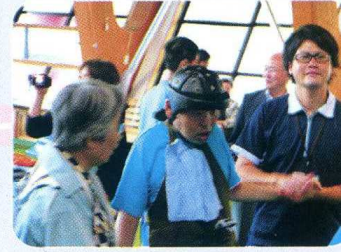
つぎ きょうぎ なに 次の競技は何かな?