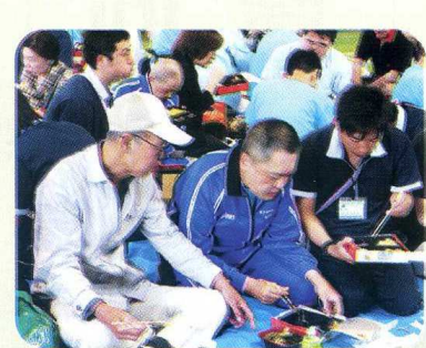
べんとう 弁当おいしい ♡♡