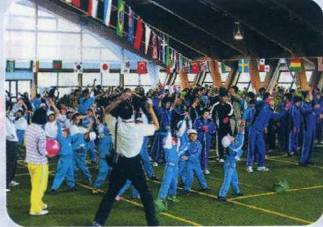
じゅんび うんどう 準備運動イチ、ニイ…