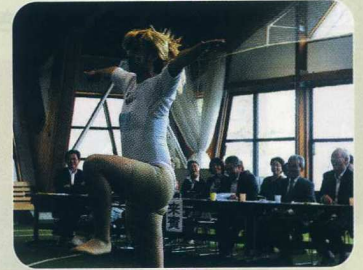
き 決めっ !!