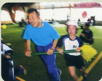
いそ いそ 急げや急げ !!