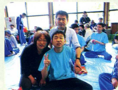
うれ みんな嬉しい ♪

今年もふれあい学園の一大イベントであるス る事が出来ました。これも偏に参加して頂いた 二一も、若い職員の皆さんが知恵を出し合いス した。最初の種目である可愛らしい園児の皆さ ごぜんちゆう しゅもくは小学生の皆さんや地域・来賓の ていました。昼食も厨房職員を中心に頑張っ は保護者の皆さんと利用者の方々を中心に和や た。来年も、皆さんとお会いできることを楽し