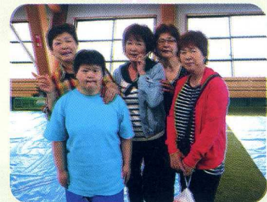
いっしょ みんなで一緒に…