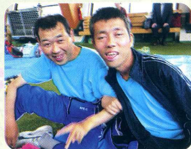
なかよ 仲良し ♪