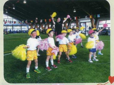
アピールしてます