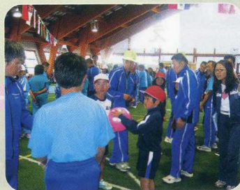
はや わた 早く渡してね