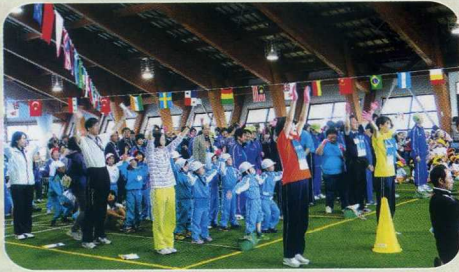
ちい うちゅう 小さな宇宙