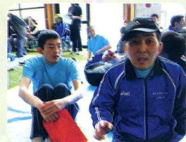
きょうだい 兄弟で…