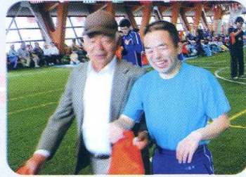
ふくる なかみ 袋の中身は!?