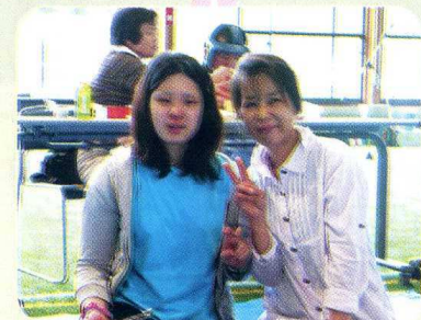
ひさ 久しぶりにお母さんと ♡