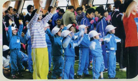
そろ みんなで揃って…