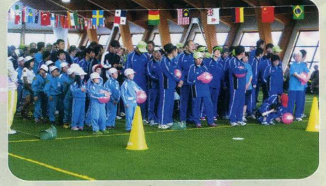
せい れつ 整列 !!