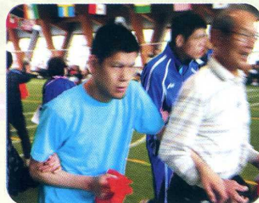
しんけん 真剣です !!