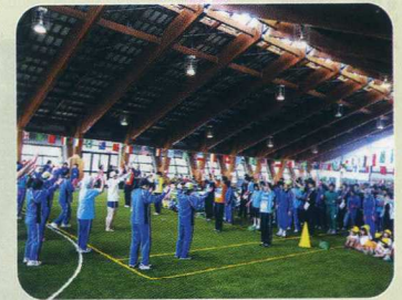
みな ぽど 皆で踊ったよ 🎵