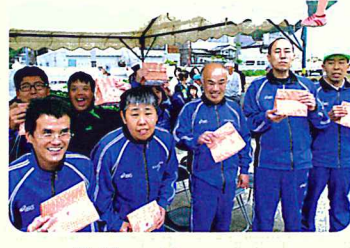
まんめんえ 満面の笑顔です！