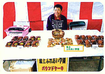
いらっしやいませ～