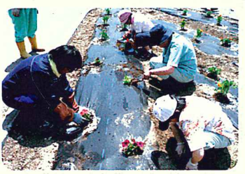
きれいに咲いてね