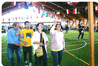
ボールを持ってハイ! シュート! ねらえ~ダンクシュート!