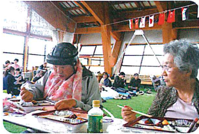
充実した時間に会話も弾みます♡

ました。午後の種目は保護者のみなさんと利用者の方々を中心に和やかな雰囲気で行進し、閉会式で大団円となりました。ここに、25回目のスポーツフェスタを無事に開催できましたことを感謝申し上げます。来年もスポーツフェスタでお会いしましょう。