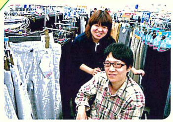
どれにしようかな？