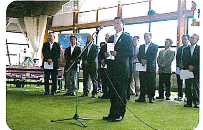
今年もありがとうございます