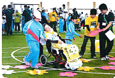
このお花に決めた!