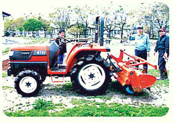
あか 赤いトラクター