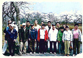
さくら 桜の下で全員集合