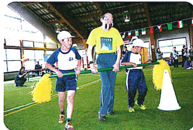
曲がり角は慎重です