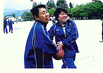
ぜんりょくしつそう 全力疾走 !!