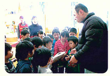
そつえん 卒園おめでとう