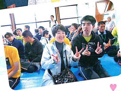
家族と一緒に、とてもステキなスマイルいただきましたあ〜♡