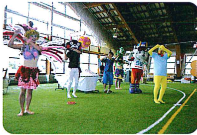
今年もオしたちが盛り上げるナツシー!?