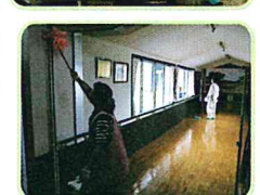
ひまわり大築、向町婦人会、民生児童委員の皆様、ご協力ありがとうございました。