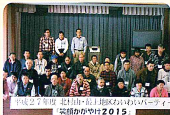
平成27年度 北村山・最上地区わいわいパーティー 「笑顔かがやけ2015」

しょうがいしゃ たいかい あせ なが 障害者スポーツ大会…いい汗、流しました ☺