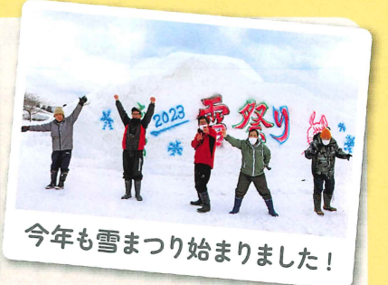
今年も雪まつり始まりました!