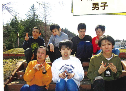
こぶし・くるみ・かつら