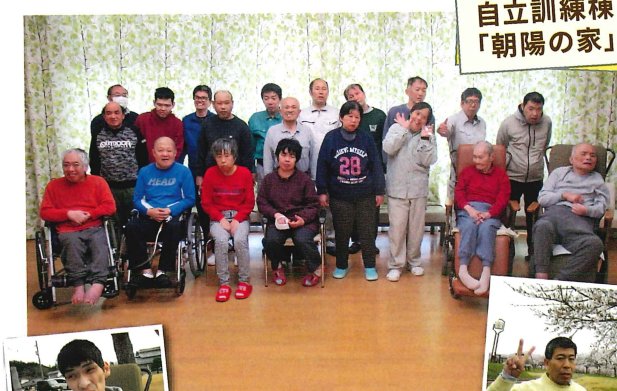
自立訓練棟「朝陽の家」

訓練棟の利用者の皆さんは、東棟と西棟の二か所に分かれて西棟は作業活動を中心として生活を送り、東棟では生活活動を中心に生活を送っています。活動範囲には差はありますが、食堂で皆さん一緒に食事をしたり、棟での活動も皆で一緒に送ることにより和気あいあいと仲良く生活しています。