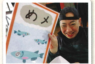
カルタとりをしました