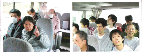
ドライブへ行って来ました。