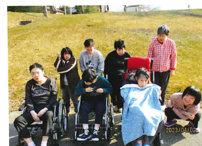
たんぼぼ・すずらん