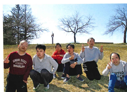
いちよう・からだち

東棟は男女合わせ40名の方が生活しており、年齢の幅はありますが皆さん元気に毎日を過ごされています。主な日中活動は個別での歩行となっておりですが、時々ドライブなどを取り入れ楽しい時間も過ごしていただいております。これから個々に合わせた活動の充実を図っていただきたいと思います。