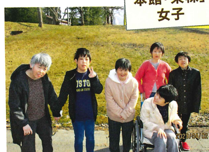
すみれ・りんどう