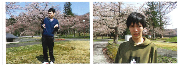
お花見 今年の桜もキレイ~!!