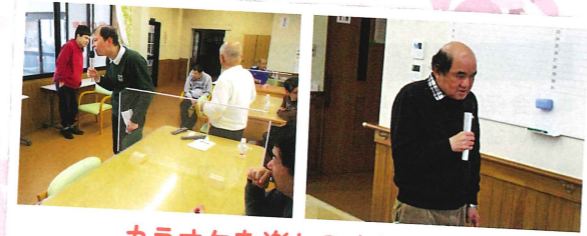
カラオケを楽しみましたよ♪