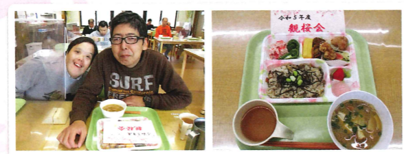
お昼の手作りお弁当