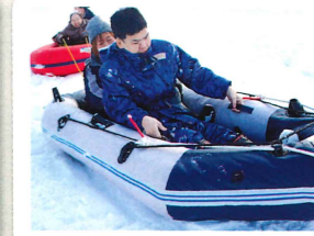
モービルボートに乗って