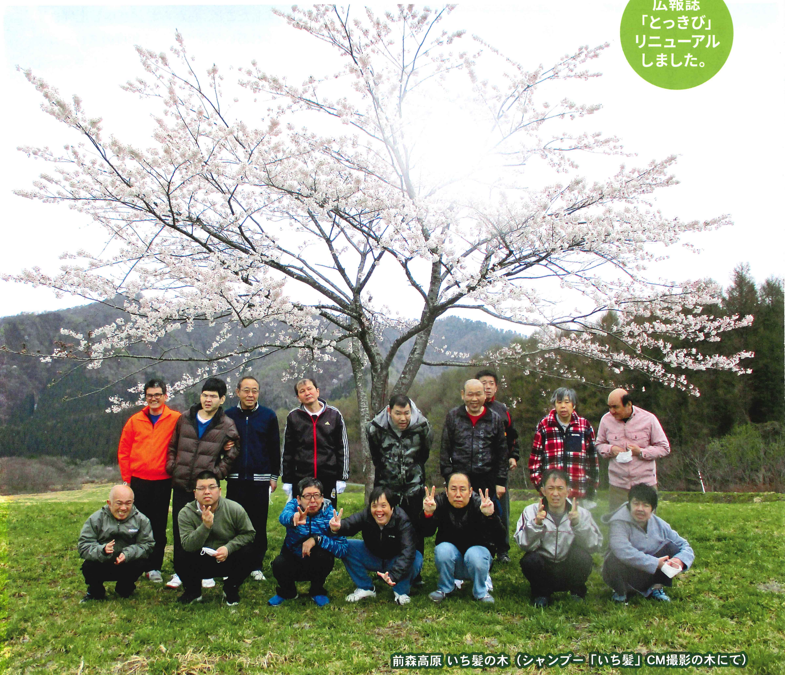
前森高原 いち髪の木 (シャンプー「いち髪」CM撮影の木にて)